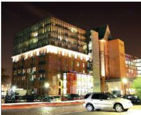
Am Tor zur Welt: Der Sitz der Vargold Investmentbank ist in der ersten Reihe am Hamburger Hafen