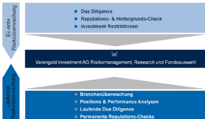
Abb. 2: Das VARENGOLD Risikomanagement